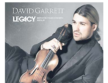
David Garrett: Legacy