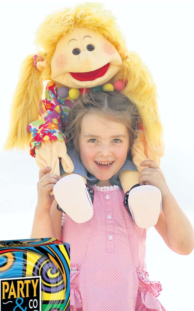
Zur Handpuppenfamilie der „Living Puppets“ – der „lebenden Puppen“ – gehören fast 200 unterschiedliche Hand- und Tierpuppen, so genannte Quasselwürmer und eine große Auswahl an Zubehör.

lässt sich die Zeitgeschichte weltberühmter Städte wie New York City oder London entdecken. Echte Highlights der 4D Cityscape Time Puzzles sind die Miniaturen der bekanntesten Gebäude der Stadt, mit denen das Puzzle im letzten Spielschritt sogar in die Höhe wächst.