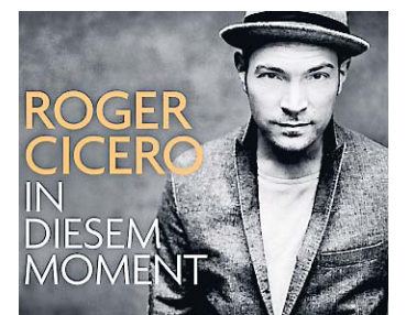
Roger Cicero: In diesem Moment