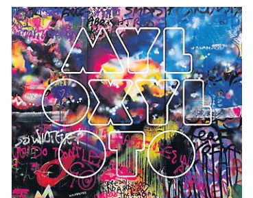
Coldplay: Mylo Xylo

★★★ Andy Bown: Unfinished Business. Status Quo-Keyboards Andy Bown hat 'ne eigene Platte veröffentlicht. Man höre und staune: Weit ab vom Quo-Sound ein gutes Album. Her damit.