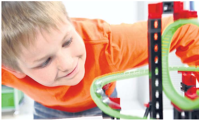
Mit dem neuen Set lernen Kinder ab neun Jahren spielerisch, dass Physik weit mehr ist als mathematische Formeln und Gleichungen.

Spielerisch die Welt verstehen – das geht mit den neuen Produkten, an denen neben den Kindern auch die Erwachsenen ihren Spaß haben. Schon längst haben Spielwarenhersteller den pädagogischen Ansatz in ihre Arbeit integriert. Herausgekommen ist Spannendes, Lustiges und Unterhaltsames für Groß und Klein.