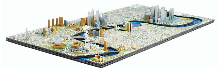
4-dimensionale Städtepuzzles mit bekannten Gebäuden im Miniformat gibt es von der Firma Jumbo. Hier im Bild: London.

★★★ Mit einem Kuscheltier die tollsten Geschichten zu erzählen – das können Kinder selbst mit den Living Puppets anstellen, indem sie mit ihren eigenen Händen in die Hände der Puppe oder in ihren plüschigen Kopf hineinschlüpfen. Dann wird den kleinen, kuscheligen Menschen die eigene Stimme geliehen, ihr Mund bewegt sich dank des „Klappmaulprinzips“ und schon kann's losgehen mit der eigenen Puppenshow.